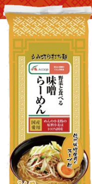
野菜と食べる 味噌ラーメン (3人前) 330円(税込)