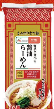
野菜と食べる 醤油ラーメン (3人前) 330円(税込)

直売所で「エコープ野菜と食べるラーメン」と「新鮮野菜」を買って、作って食べてみよう!!