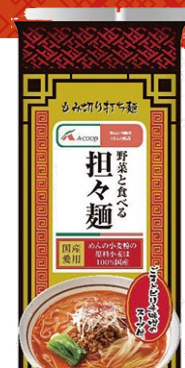
野菜と食べる 担々麺 (3人前) 390円(税込)

エコープマーク品とは、国産原料へのこだわりと安全・安心をお届けするJAグループのプライベートブランドです。