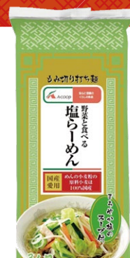
野菜と食べる 塩ラーメン (3人前) 330円(税込)