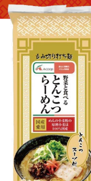
野菜と食べる とんこつラーメン (3人前) 330円(税込)