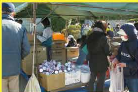
東日本大震災での気仙沼の避難所