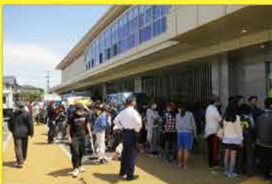
熊本地震で避難所で配給に並ぶ住民