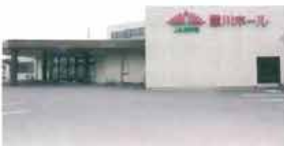
思川ホール TEL.0285-38-3100 携帯電話にご登録ください 小山市萩島134