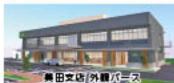
美田支店/外観パース