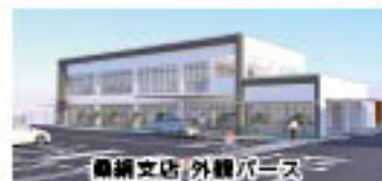
桑網支店/外観パース

令和元年5月に開催した第20回通常総代会にてご承認いただいた支店再編整備計画は、令和3年2月に新築1号店舗である大谷支店がグランドオープンし、第1期再編を完了しました。リニューアル後の間々田支店、本店移転後の小山支店ともども組合員並びに利用者皆様方の満足向上に向け鋭意、事業に取り組んでいます。