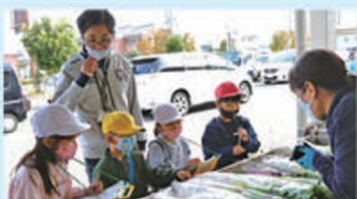
積極的に質問をし、真剣に話を聞く児童

生活科の学習の一環で「どきどきわくわくまちたんけん」として職場見学（町探検）を行いました。地域の商品や施設などが自分の生活とどう関わっているかなどを知ることが狙いです。児童らは直売所のスタッフの説明に真剣に耳を傾けました。