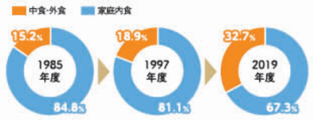
米の消費における家庭内および中食・外食の占める割合(全国)