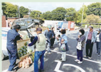
ＪＡおやま産の農畜産物をPR

軽トラックは、青年部員が運転をし、同ＪＡのアクティールから出発。野木町の「野木町コミュニティセンター」と下野市の「道の駅しもつけ」で無料配布を行った他、「フードバンクとちぎ」にも提供しました。