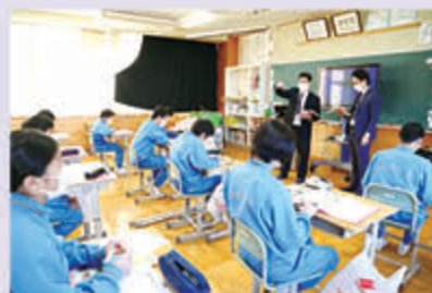
中学生に「J Aとは何か、J Aの仕事とは」を教える職員

当日は、J Aの職員2名がJ Aの業務内容について説明。学生からは「J A職員にはどのような人が向いているのか」「農業も機械化が進んでいるが実際はどうか」「どのような思いで仕事を行っているのか」などJ Aに関心を寄せる声が集まりました。