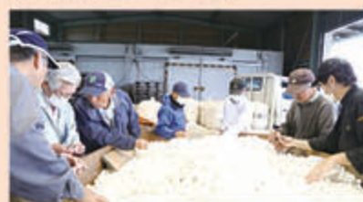
選除蒔作業を行う出荷者

生産者7戸が袋詰めを持ち込んだ約1,380キロ（箱物で275反分）の蒔は、選蒔台（せんけんたい）に載せ、汚れ蒔、穴あき蒔、薄皮蒔、玉蒔などを出荷者が手作業で取り除く「選除蒔（せんじょけん）」を行い、群馬県の碓氷製糸に送りました。