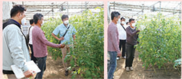
生育状況を確認する参加者

同北部部会は6人で約1.7ヘクタールを栽培。品種は「みそら」「マイロック」が中心。出荷は11月から翌年6月までで、約300トンを京浜方面に送ります。