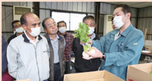
規格を確認する参加者