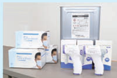
購入した非接触温度計や不織布マスクなど