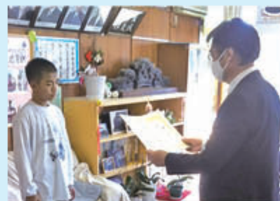
図画コンクール入賞者を表彰

入賞作品は、家の光協会主催の「世界こども図画コンテスト」に出展。入賞作品を集めた2021年カレンダーを作成し、入賞者や管内の各小学校に配布しました。