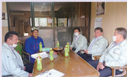
生産者と意見交換する福田組合長（右から3人目）